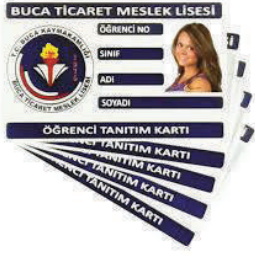
Baskılı Proksi Kart