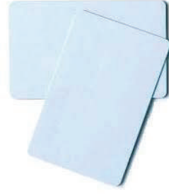
Proksi Personel kartı Baskısız